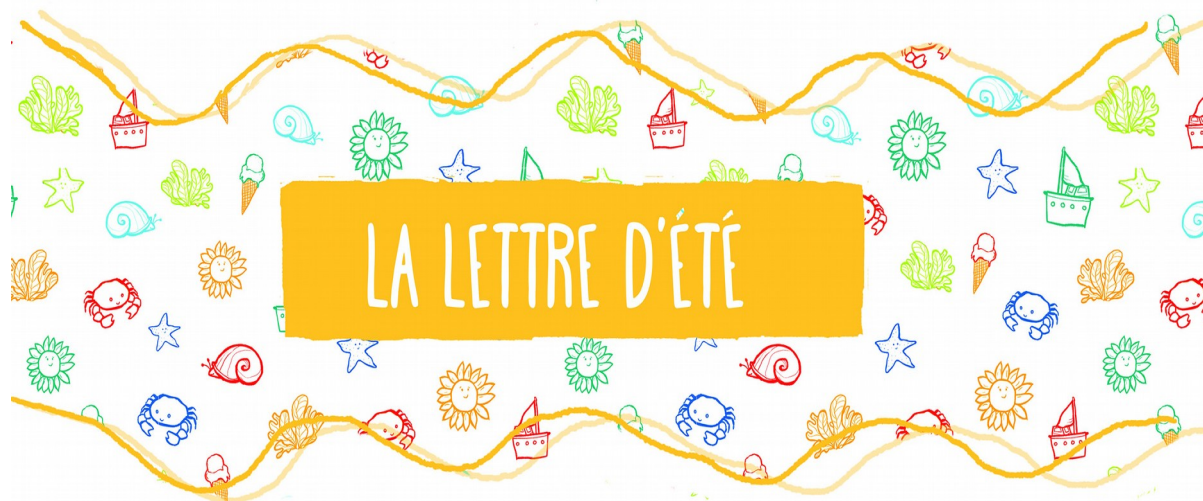
Illustration de Sonia Pez

En voilà une de lettre qui se lit sous un parapluie comme sous un parasol. Pourquoi pas même, suspendu au parapet, cheveux aux vents. Non pas cheveux cirés à la paraphine. A moins qu'il fasse bon vivre dans un pot de confiture? Lire en bocal loin des parasites, serait - ce un paradis? A l'abri de son couvercle, paratonnerre idéal contre les foudres et autres embrasements par temps chauds. Ce qu'il y a, c'est qu'il ne fait pas si chaud d'abord! Mais par rapport à quand, d'ailleurs? Et qu'à force de paraphrases, on se noie dans le stérélisateur. Alors mieux vaut briser la glace, éclater le verre, lire en plein air! Etendez- vous sur la nappe ou faites- en un parachute, dégoulinez parallèlement dans l'herbe, mais ne vous prenez pas pour une marmelade. Le paradigme du jour, c'est de lire hors d'air, derrière un paravent éventuellement. Pasteurisons nos coulis, pas nos neurones afin d'éviter tout confit de cervelle.