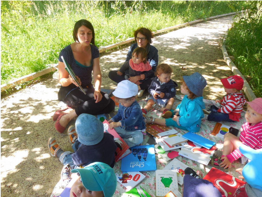
Photo du SENSATOUTI d'été dans les marais de Trestel, en juin 2017